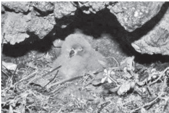
Sturmtaucherküken in einem neuentdeckten Nest auf Isabela

Im Hochland von Puerto Villamil auf Isabela wurde ein Nest des Galápagos-Sturmtauchers gefunden. Die Anwesenheit dieser Vögel wurde durch den Fund frischer Federn und Kot bereits bestätigt. Nun weiss man auch, dass die Tiere auf Isabela brüten.