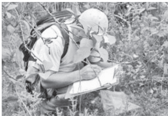
Ein Parkranger sammelt wichtige Daten in San Pedro, Isabela