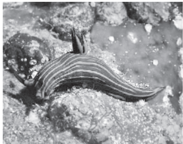
Nacktkiemer im Korallenriff vor der Insel Wolf