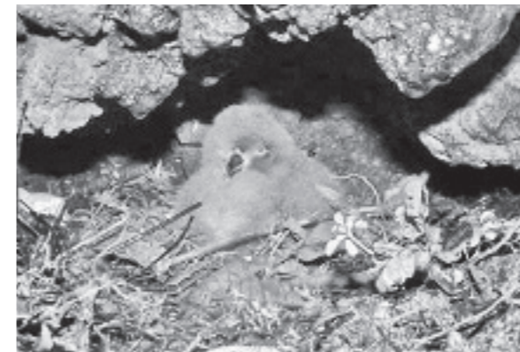
Sturmtaucherküken in einem neuentdeckten Nest auf Isabela

Im Hochland von Puerto Villamil auf Isabela wurde ein Nest des Galápagos-Sturmtauchers gefunden. Die Anwesenheit dieser Vögel wurde durch den Fund frischer Federn und Kot bereits bestätigt. Nun weiss man auch, dass die Tiere auf Isabela brüten.