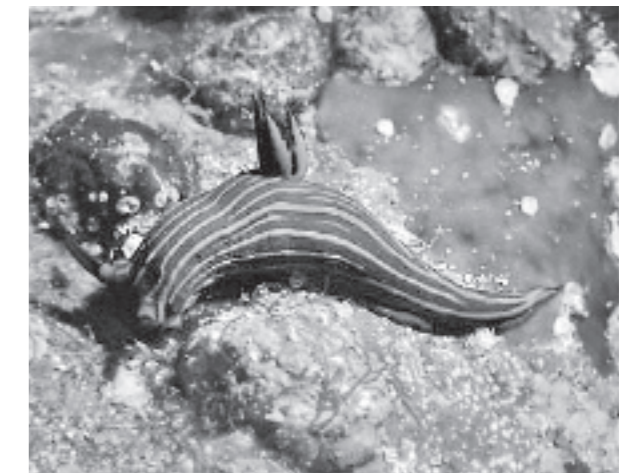
Nacktkiemer im Korallenriff vor der Insel Wolf