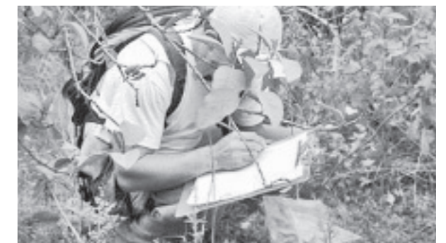
Un gardien du parc collectionne des informations importantes à San Pedro, Isabela.