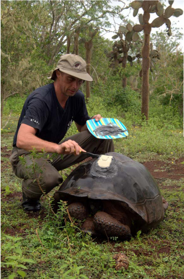
Auch Nigrita erhält einen Sender